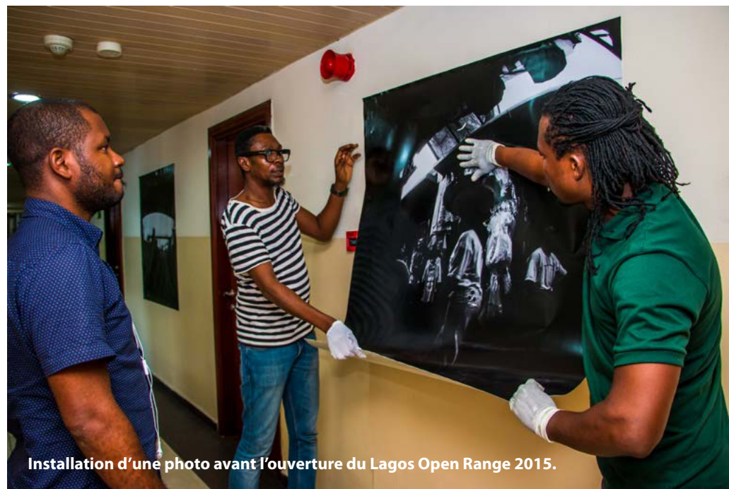
Installation d'une photo avant l'ouverture du Lagos Open Range 2015.

UO – L'un des principaux défis auxquels nous avons été confrontés était le financement et faire comprendre au gouvernement nigérien ce que nous faisons. Cela peut prendre un certain temps, mais je suis sûr que nous y arriverons. Un autre aspect a été l'infrastructure. L'un des défis auxquels nous sommes continuellement confrontés est l'espace. Certaines des choses que nous voulons faire, est notamment de lancer un projet massif de collecte de fonds qui nous garantira la construction d'un nouvel espace. Nous avons récemment perdu notre espace et avons dû en chercher un nouveau. Nous avons trouvé un endroit convenable pour le moment et j'espère que dans le prochain mois et demi, nous pourrions résoudre ce problème. Actuellement, nous sommes incapables de poursuivre tous les projets que nous aimerions, en raison du financement, de l'espace et de l'économie nigérienne en général.